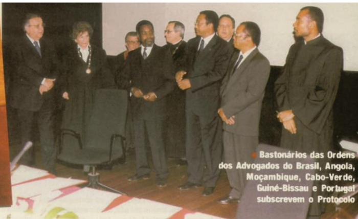
• Bastonários das Ordens dos Advogados do Brasil, Angola, Moçambique, Cabo-Verde, Guiné-Bissau e Portugal subscrevem o Protocolo