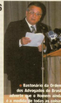
• Bastonário da Ordem dos Advogados do Brasil adverte que o Homem ainda é a medida de todas as coisas